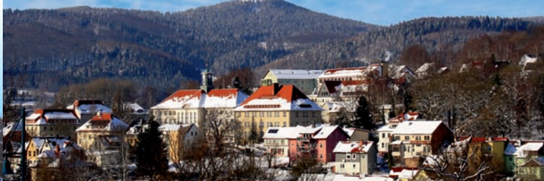
Ruppberg, Hausberg von Zella-Mehlis 866 m ü. NN

Tourist-Information Zella-Mehlis Louis-Anschütz-Straße 28 98544 Zella-Mehlis